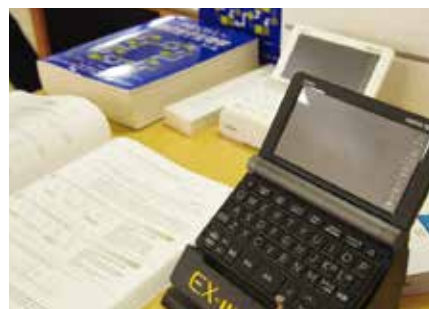
教科書等勉強用品

「新入生サポートセンター」では、岡山大学生の先輩が、お部屋紹介や大学生活相談などのアドバイザーとして活躍しています。