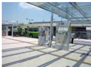
岡山駅運動公園口（西口）バスターミナル付近