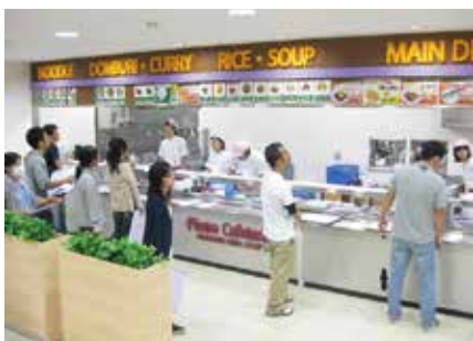
食育ミールカード