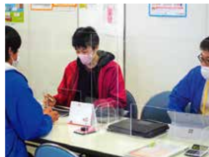
生協・共済加入手続き