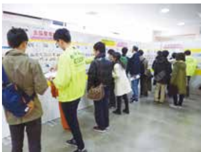
2,000室以上の豊富な物件

○お部屋探し ○生協・共済加入 ○食育ミールカード ○パソコンなど勉強用品 ○教科書購入情報