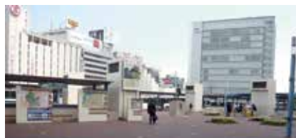
岡山駅後楽園口（東口）バスターミナル付近