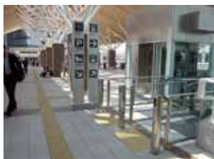
岡山駅在来線中央改札から西に出たところ