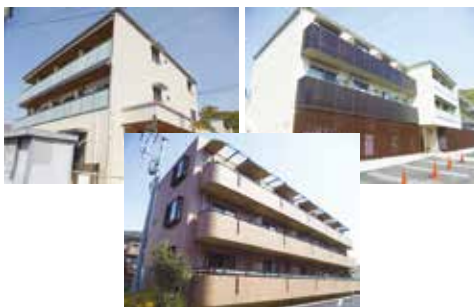
安心の生協管理物件