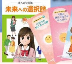
ライフプランを考えよう 妊孕性啓発マンガ パンフレット ダウンロード可能