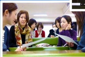
各種のグループワーク