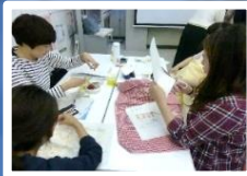
グリープケア テnder ラビングケア