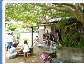
子育て広場で学ぶ