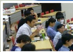
卵子凍結・提供、NIPTなどの生命倫理 不妊・不育・風疹予防・子育て支援 虐待防止など 各種の公開セミナー