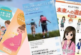
LGBTQ・性別不合の基礎知識 「封じ込められた子ども、 その心を聴く」発売中

▼e-ラーニングで遠隔地 や時間外でも授業に参加 ▼現場の講師による実践的 な演習や実習 ▼超音波シミュレーション 装置、新生児挿管モデル で思う存分練習