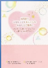
流死産の方へのパンフレット