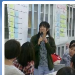
妊娠中からの虐待予防