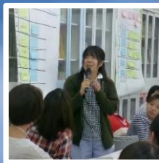
妊娠中からの虐待予防