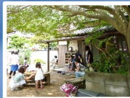
子育て広場で学ぶ