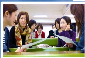
各種のグループワーク