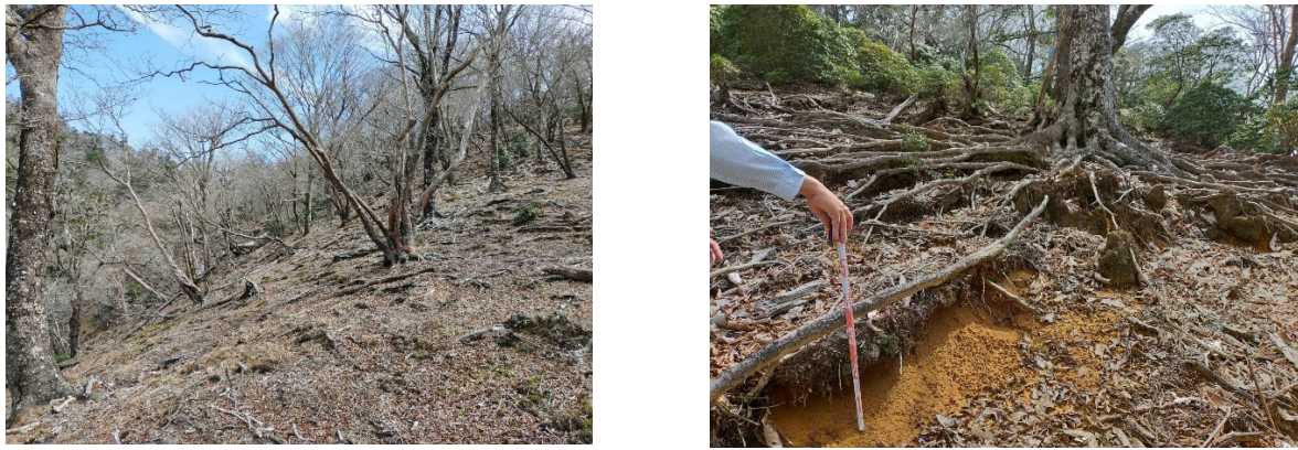
図1 下層植生の消失した三方岳の概況（左）と深刻な根系露出の例（右）。