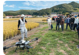
水稲栽培でのドローンの利用