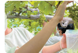
ブドウのジベレリン処理