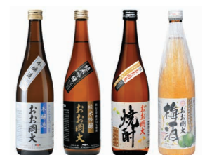
おお岡大（日本酒、焼酎、梅酒）