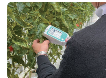
トマトの多収生産のためのパラメータ測定