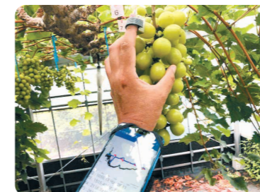
ブドウの樹上音響果実熟度測定

ブドウの非破壊の果実熟度の測定や、高度な環境制御技術を駆使したトマト、イチゴの施設栽培に関する研究に取り組んでいます。