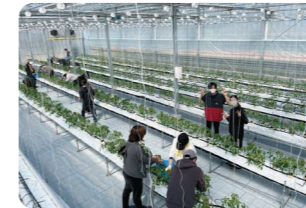
トマトのハイワイヤー栽培実習