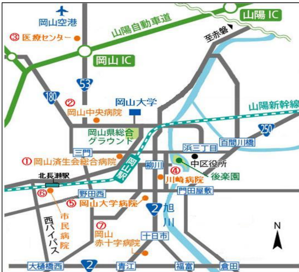
写真 3 岡山大学周辺の主な病院 略地図